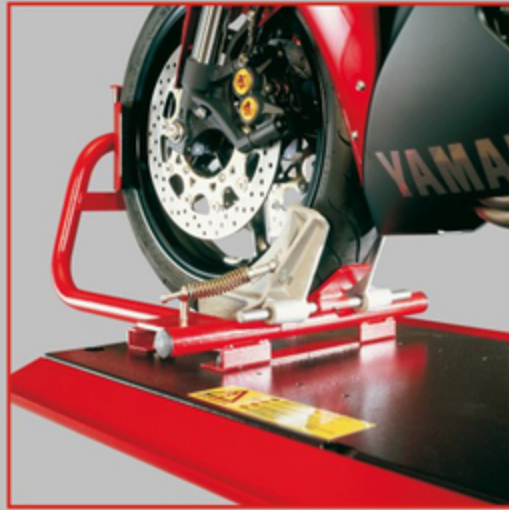
Ganasce in alluminio con sistema brevettato Aluminium jaws mounted on the patented system