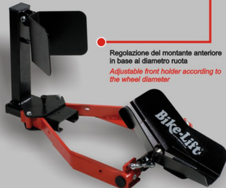
Regolazione del montante anteriore in base al diametro ruota Adjustable front holder according to the wheel diameter